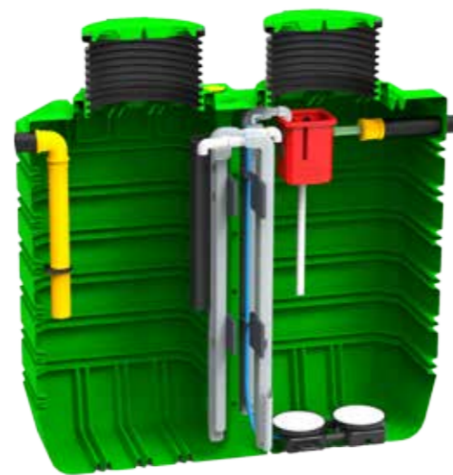
4-8 EW 6000 L