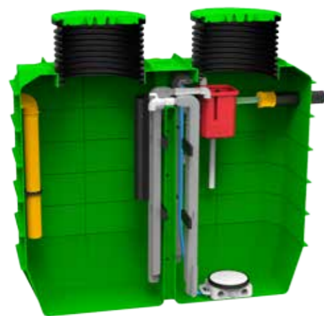
2-4 EW 4000 L